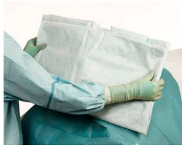
6 Vouw eerst de zijkanten open ...