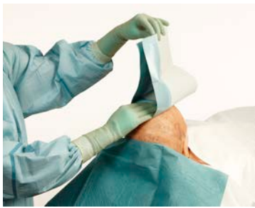
1 Vorm een vierkant met de zelfklevende afdekdoeken. Eerst de onderste, dan de bovenste ...