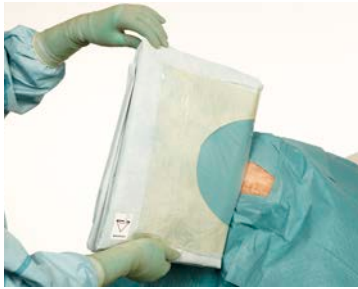
5 Plaats het laken in het midden van het operatiegebied.