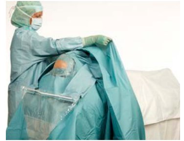
8 Vouw het laken open in de richting van de voeten van de patiënt.