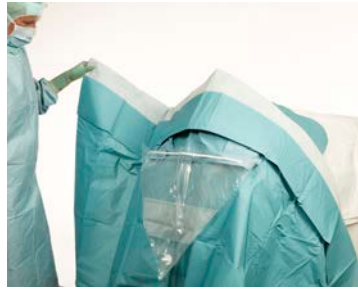
7 ... en vouw vervolgens het laken naar beneden open.