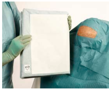
3 Plaats het laken met de opvangzak in de juiste richting (zie pictogram).