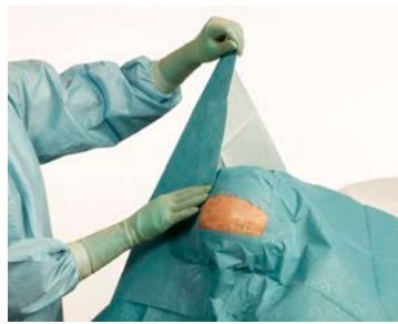
2 ... en tenslotte de afdeklakens aan de zijkanten.